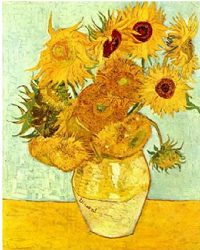
"Os Girassóis" (1888)